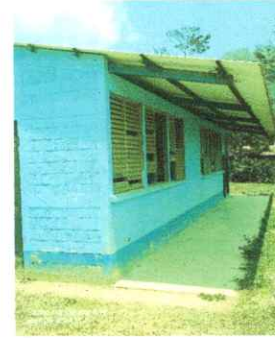
Foto 2: EN TODAS LAS FALTAN VIDRIOS POR TAL MOTIVO SE SUSTITUIRAN PARA UN AMBIENTE AGRADABLE