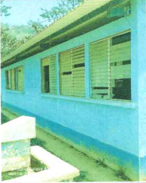
Foto 1: SE OBSERVA EL DETERIORO DEL VIDRIOS Y/O FALTANTE POR TAL RAZON SE SUSTITUIRAN