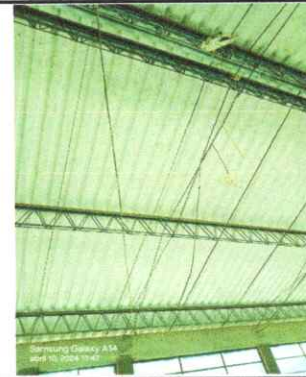
Foto 4: LOS CABLES DE ENERGIA ELECTRICA ESTAN UNICAMENTE AÑADIDOS Y EN DETERIORO