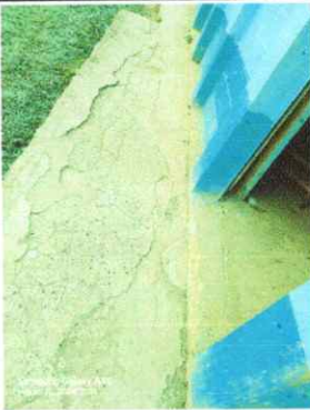
Foto 3: SE OBSERVA EL DETERIORO DEL PISO ENTORTADO POR ESO SE SOLICITA LA REMODELACION