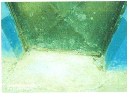
Foto 5: LAS PUERTAS SE HAN IXIDADO POR COMPLETO. SOLICITAMOS EL CAMBIO